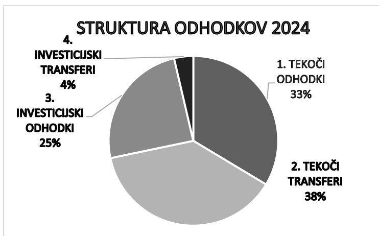
Graf 3: Struktura posameznih vrst odhodkov leta 2024 v celotnih realiziranih odhodkih

Odhodki so bili realizirani v višini 2.473.665 EUR, kar je za 8,2 % manj kot je bilo planirano. V strukturi vseh odhodkov predstavljajo najvišji delež tekoči transferi, in sicer 36,66 % vseh odhodkov. Sledijo jim tekoči odhodki, nato investicijski odhodki. Najnižji odstotek predstavljajo investicijski transferi.